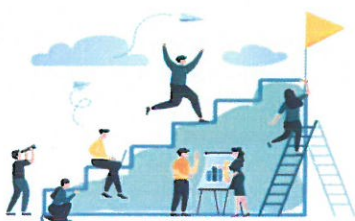
Opțiuni strategice - Program de dezvoltare

Pentru tranziția la o economie durabilă din perspectiva mediului, circulară și neutră din punct de vedere climatic și promovarea unei culturi a sustenabilității, Școala Gimnazială „Ion Pillat” Pitești își propune creșterea gradului de sustenabilitate și reducerea amprentei de dioxid de carbon prin implementarea unor proiecte de mediu comune, dezvoltarea de parteneriate în vederea reabilitării unității.